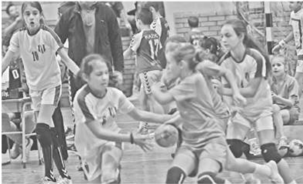
Са претходног турнира Растимо

Традиционални Међународни турнир у рукомету и мини-рукомету Растимо - Трофеј града Новог Сада по 21. пут, под покровитељством Града и уз велику помоћ Управе за спорт и омладину, одржаће се у великој и малој дворани СПЦ "Војводина" (Спенс) и сали ОШ "Јожеф Атила". Очекује се учешће више од 500 младих рукометаша и рукометашаца, узраста од шест до 16 година, из Србије, Републике Српске и Црне Горе.