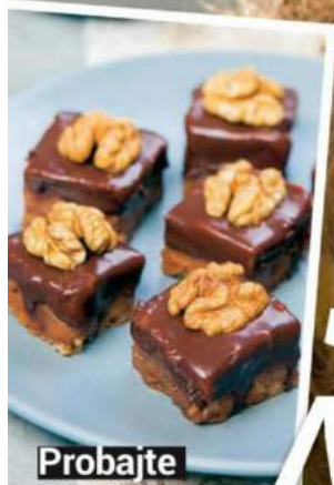
Probajte reform kocke